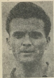
Капитанът на Атлетико Мадрид дясното крило Мигуел