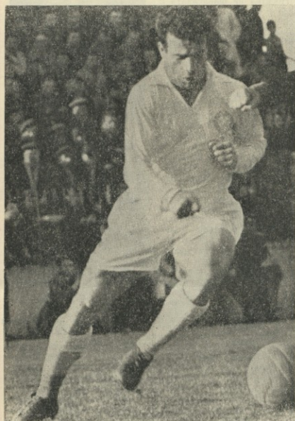
Неговият устрем и резултатност са добре известни — Милано

Езикът на цифрите е категоричен. Той не се нуждае от коментари.